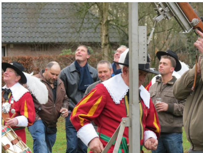
Het schieten in volle gang....