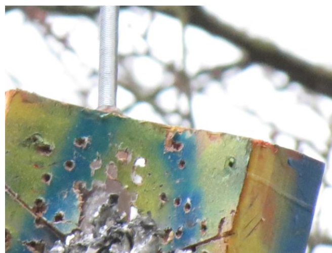
de vogel flink geraakt... maar nog steeds boven..