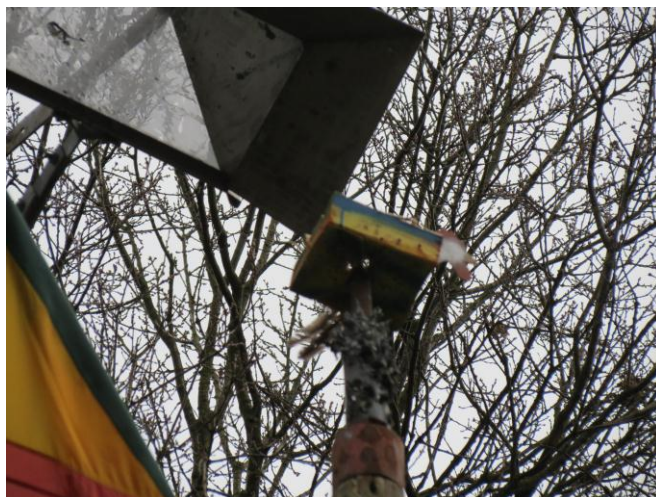
Jaa...die moet eraf.....