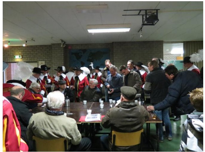
Genietend van een bakje koffie werd uitgelegd wat de bedoeling van het schiet-evenment was.