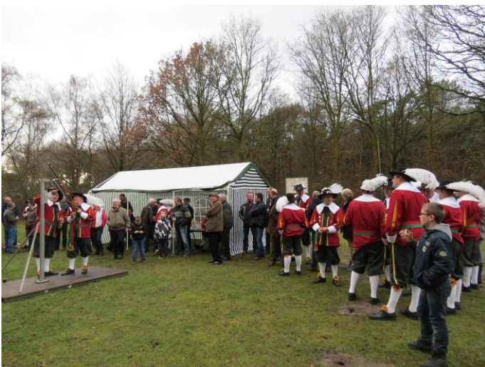
Terwijl de wapenmeesters nog even controle uitvoeren, staan gildebroeders en oudkoningen al vrijet klaar...