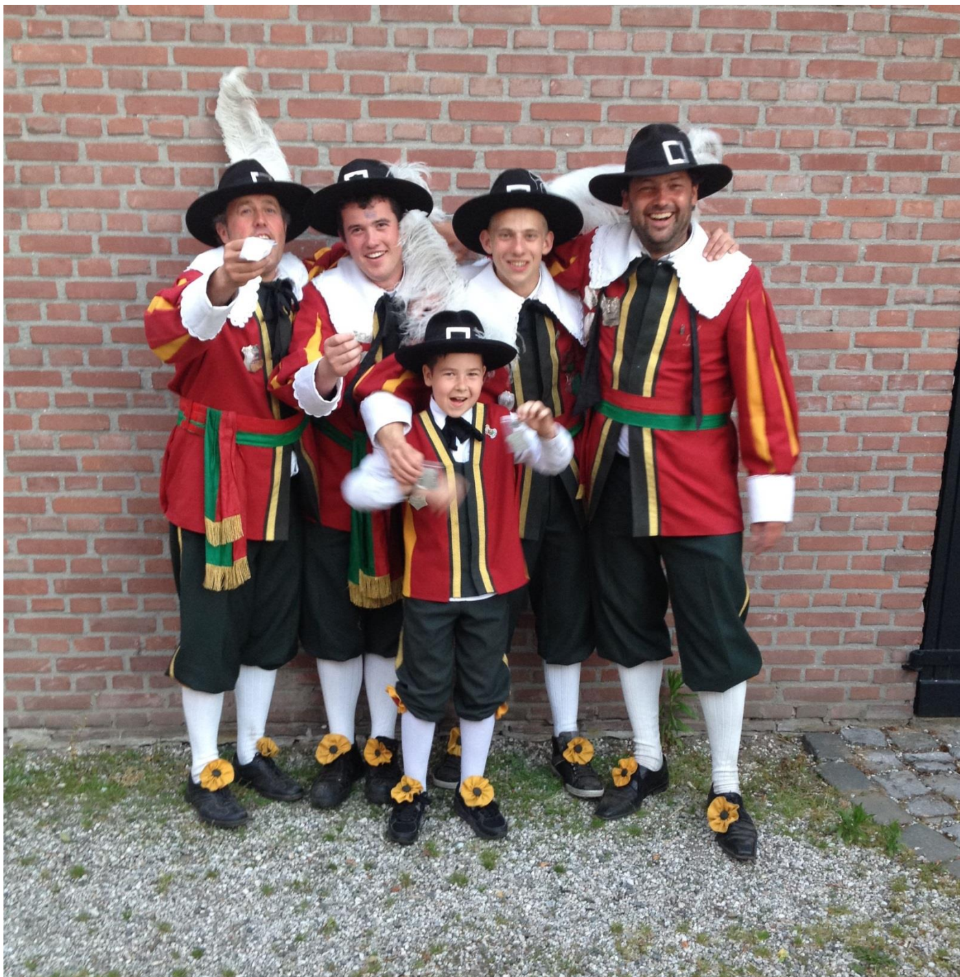
Hier enkele van onze prijzen-jagers.....knap gedaan mannen...proficiat...